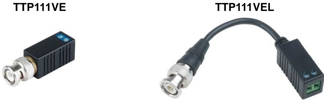
Рис.1 Внешний вид ТТР111VE, ТТР111VEL

Пассивные приёмопередатчик ТТР111VE (ТТР111VEL) видеосигнала по кабелю витой пары на расстояние до 600м.