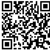
Прошивки и утилиты