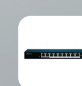
DS-S908P(B) Неуправляемый PoE-коммутатор, 8 PoE, 1 up-link