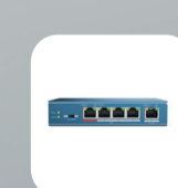
DS-S504P(B) Неуправляемый PoE-коммутатор, 4 PoE, 1 up-link