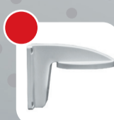
DS-1258ZJ Внутренний настенный кронштейн