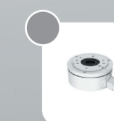
DS-1280ZJ-XS Монтажная коробка