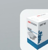
DS-1L1N5E-E/E DS-1L1N6E-W Кабель UTP (медь)