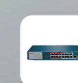
DS-S1816P(B) Неуправляемый PoE-коммутатор, 16 PoE, 1 up-link, 1 SFP