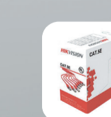
HWC-5EAU-6 HWC-6AU-W Кабель UTP CAT 5e и 6 категории (омедненный)