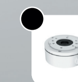
DS-1280ZJ-S Монтажная коробка