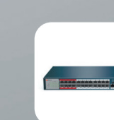
DS-S2624P(B) Неуправляемый PoE-коммутатор, 24 PoE, 1 up-link, 1 SFP