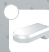
DS-1294ZJ-PT Настенный кронштейн