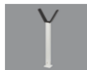
Регулируемая вилочная опора для стрелы