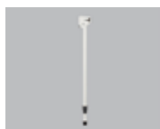
Регулируемая подвесная опора