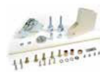
Шарнир - высота потолка 3 м (только для стандартных стрел прямоугольного сечения)