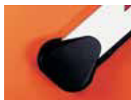
Крепление для стрел прямоугольного сечения

стрелы прямоугольного сечения оснащаются резиновым профилем с возможностью установки защитной кромки.